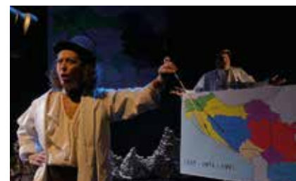
Grad, de Teatro de la Resistencia

La programación se cerrará el 16 de diciembre con el habitual Concierto de Navidad a cargo de la Big band UJI.