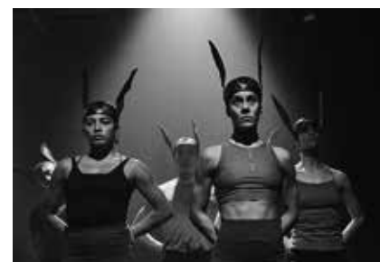
No pleasure, de Iker Karrera