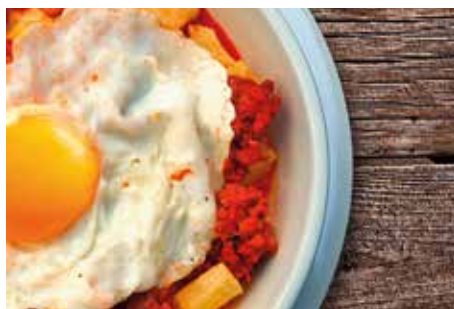
Huevos rotos con Sobrasada de Mallorca

Dependiendo de la raza de cerdo se diferencia dos tipos de sobrasadas: Por un lado, la "sobrasada de Mallorca", que está elaborada con carnes de cerdo de todas las razas; y por otra, "Sobrasada de Mallorca de cerdo negro", preparada únicamente con carnes de cerdo de raza autóctona mallorquina, criados y cebados en la isla de Mallorca según las prácticas tradicionales, en régimen extensivo o semiextensivo.