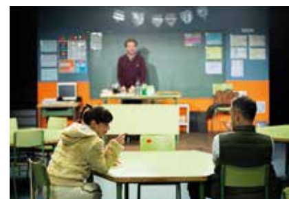
Classe, de Focus.cat